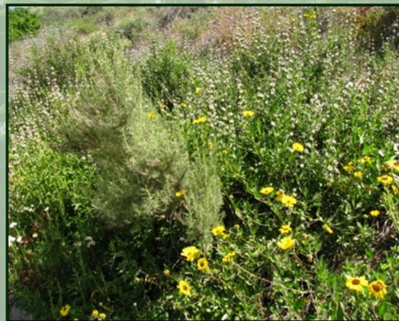
Sage scrub 서식지

코요테 힐즈 동부 보호구역은 Unocal Land and Development Company 가 이 지역을 개발하면서 자연을 보존하는 규정에 따라 지정되었습니다. 이 규정은 멸종되어 가는 gnatcatcher 를 지키는 방법이었습니다. 미국에 Fish and Wildlife Service 와 California 주에 Department of Fish and Wildlife 에서 이 골프장과 근처에 있는 주택들은 자연 환경을 지키고 새로운 서식지를 만들어 줄수 있게 디자인되었습니다. 자연토지 관리 센터, CNLM,이 2004도 부터 이 보호구역을 관리합니다. 이 땅에 살고있는 생물들이 계속 지킴을 받고 이 땅들이 보존되게 CNLM은 conservation easement (개인 소유의 땅을 맡아서 관리하는 규정)를 담당하고 있습니다.