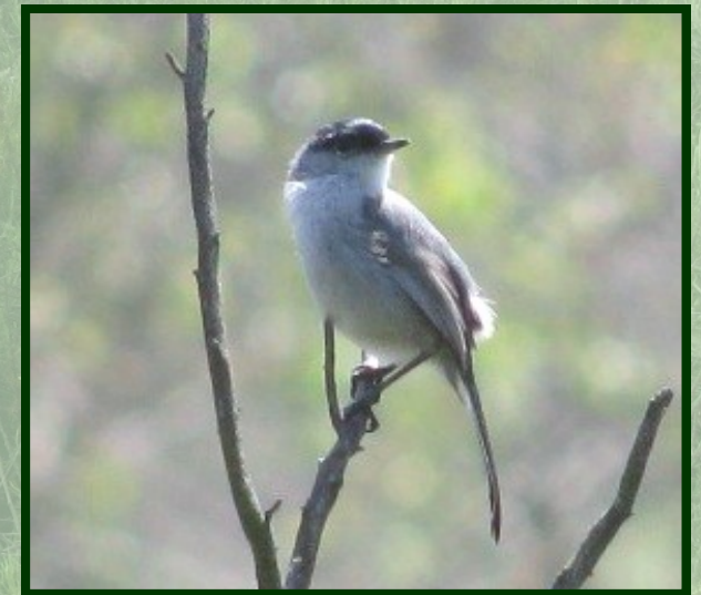
California gnatcatcher (male)