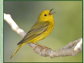
Yellow Warbler

없습니다. CNLM 직원들에게만 입장이 가능합니다. 이 제한은 골프장 옆에 있는 땅도 포함됩니다 (지도에