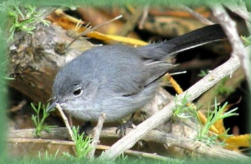
California gnatcatcher (female)

이 보호구역에 있는 땅들은 주로 sage scrub 과 물이 흐르는 곳들입니다. Sage scrub에서 자라는 샬비어와 메밀과 잡초들은 California gnatcatcher의 먹이로 다른 서식지에서는 살수 없습니다. 이 보호구역에 살고있는 약 30쌍의 gnatcatcher들에게는 매우 중요한 곳입니다.