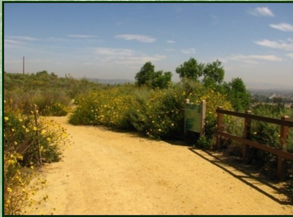
파노라마 파크 길

걷는분들, 자전거 타시는 분들, 말 타시는 분들은 파노라마 파크 길을 사용해서 보호구역을 즐길 수 있습니다. 이 길에서 멋있는 Orange County 의 경치를 볼수있으며, 거리에있는 싸인판들이 보호구역에 대하여 설명해 드립니다. 이 길은 Bastanchury Road 에서 Skyline Drive까지 가고, 보호구역 밖에서는 Brea Boulevard까지 연결됩니다.